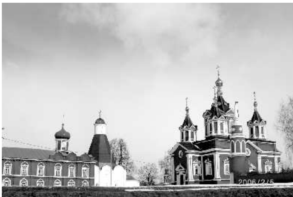
На территории Коломенского кремля

Поразительной величины стены кремля, не уступающие