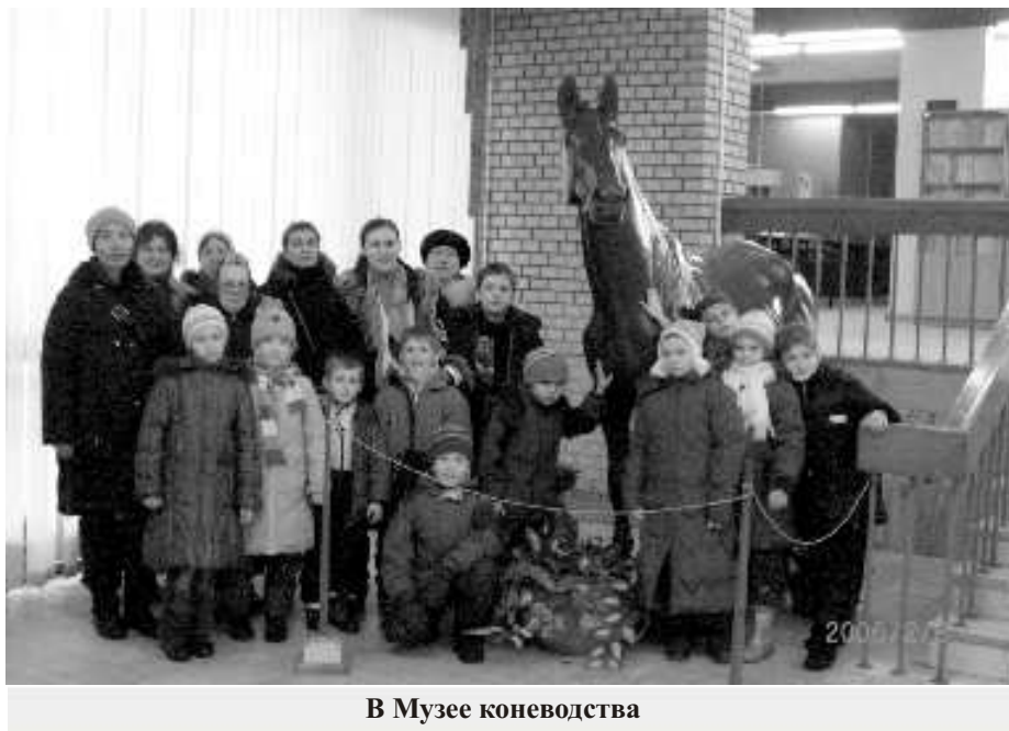
В Музее коневодства

Вот это было истинное открытие! Мы выслушали рассказ о роде Разумовских, о том, как всё происходило в этой усадьбе, пышно, поражающая великолепием, какие приемы устраивал граф, какими чудесами поражал он гостей, украшая полы прудов паркетом, вдевая в жабырыбок бриллиантовые сережки и, умудряясь использовать секреты и