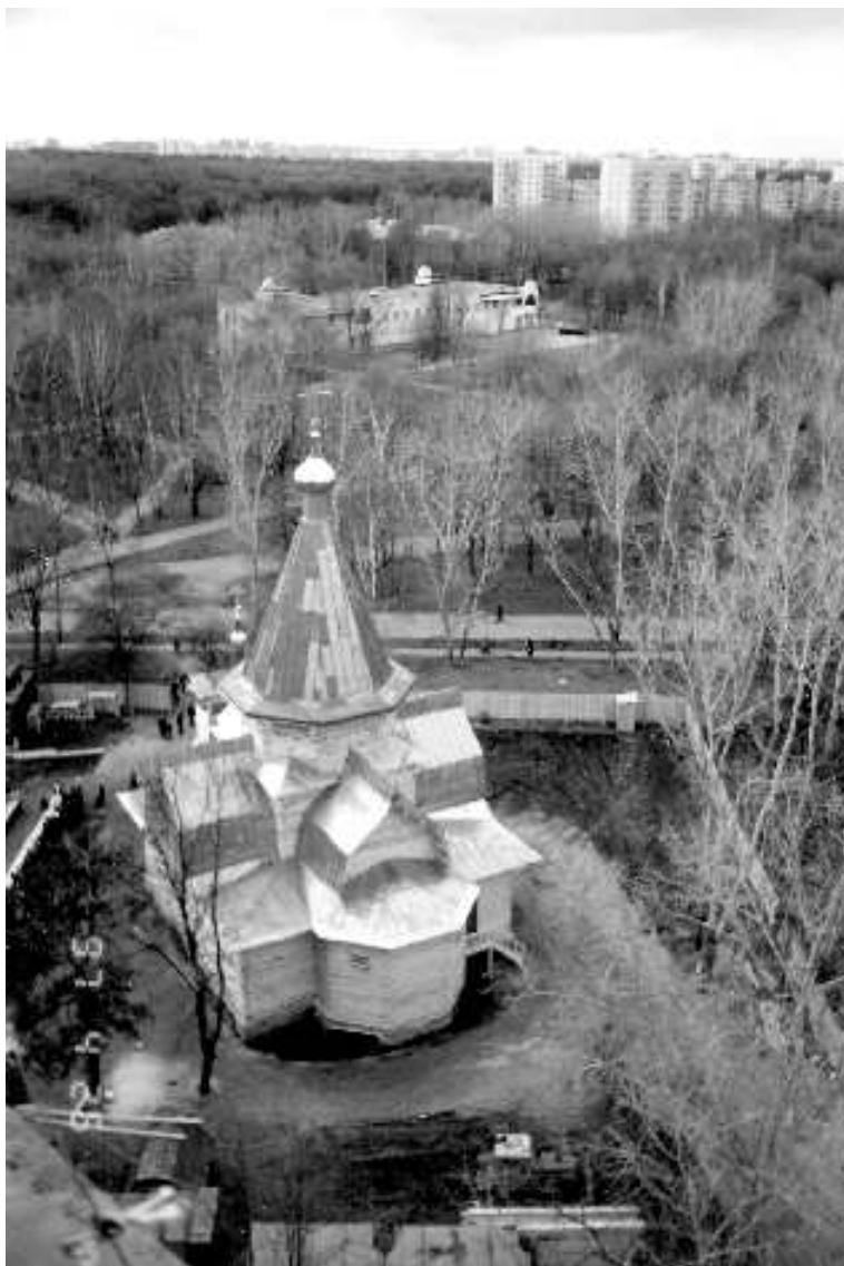
Храм святителя Николая у Соломенной сторожки. 26 апреля 1997 года

В 1997 году силами управляющих Тимирязевского района начали восстанавливать храм святителя Николая, который начал постепенно привлекать верующих. В настоящий момент этот храм является Патриаршим подворьем, великолепно оформлен и служит на благо верующих, является