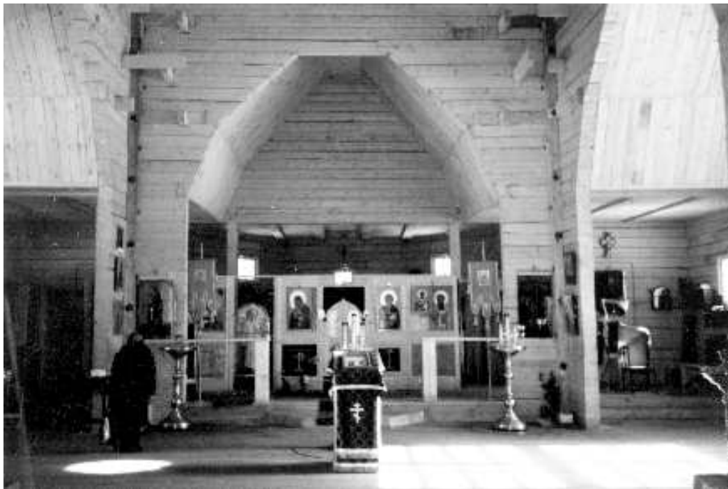
Интерьер храма. 1997 год

Но Господь везде помогал, храм всё благоустраивался. Появился отец настоятель –